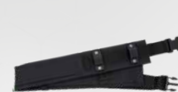
CINGHIA VENTRALE VENTRAL BELT (STANDARD)

Two large joysticks provide precise control of movement, steering and flailhead height. The simple layout of controls allows you to start working immediately. It is possible to adjust speed and steering control to satisfy at best the needs of the operator.