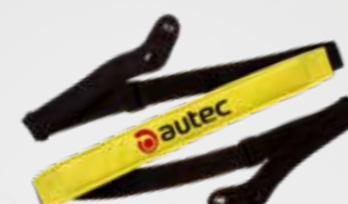
CINGHIA A TRACOLLA SHOULDER HARNESS (OPTIONAL)