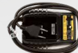
CARICABATTERIE DA 220V 220 V BATTERY CHARGER (OPTIONAL)